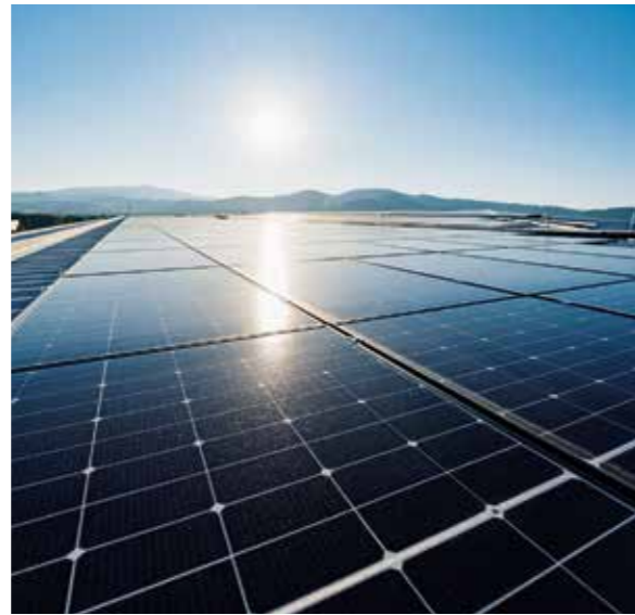
6.200 Solarmodule „made in Germany“ auf dem Stadionsdach erzeugen rund 2,3 Millionen Kilowattstunden Strom pro Jahr.

Als Digitalpartner des SC Freiburg leistet die badenova Tochter badenIT einen wesentlichen Beitrag zur Digitalinfrastruktur des neuen Stadions. Das umfasst drei wesentliche Bausteine. Erster Baustein ist die Daten- und Netzwerksicherheit, unter anderem durch ein hochverfügbares Firewall-System. Der zweite Baustein umfasst die Internetarchitektur des Stadions, durch Bereitstellung einer 10G-Internetanbindung für W-Lan, Streaming- und Komfortangeboten für die Stadionbesucher, mit der Gewährleistung der ständigen Verfügbarkeit durch Absicherung über die eigenen