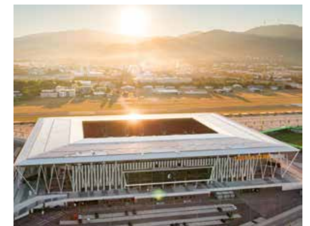
Das Solarkraftwerk auf dem Europa-Park Stadion gehört zu den größten Anlagen im Fußballbetrieb.

Meyer Burger erfüllt auch sonst die anspruchsvollen Nachhaltigkeitsanforderungen sowohl von badenova als auch von Seiten des Sportclub. Der Hersteller setzt sich dafür ein, Lieferketten transparenter, regionaler und sicherer zu machen. Alle Meyer Burger Solarzellen und -module werden ausschließlich in Deutschland in den Produktionsstätten in Thalheim (Bitterfeld-Wolfen, Sachsen-Anhalt) und Freiberg (Sachsen) gefertigt. „Wir wollen nicht nur mit dem Projekt als solchem, sondern auch mit der Qualität und Herkunft der Module ein